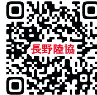
長野陸協・競技会結果

★今後も、情報・お願いをFAXもしくは、県・上伊那陸協のホームページへ記載していきますので、常に気にしていただき、ご覧ください。よろしくお願ひ致します。