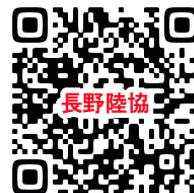
長野陸協・競技会結果

★今後も、情報・お願いをFAXもしくは、県・上伊那陸協のホームページへ記載していきますので、常に気にしていただき、ご覧ください。よろしくお願ひ致します。